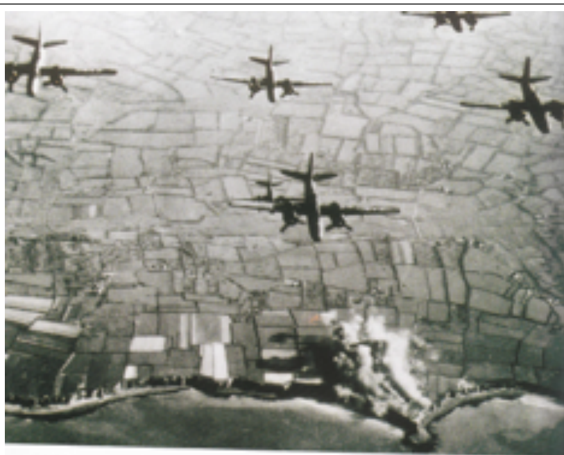
O desembarco aliado de Normandía en xuño de 1946 puido ser na Costa da Morte