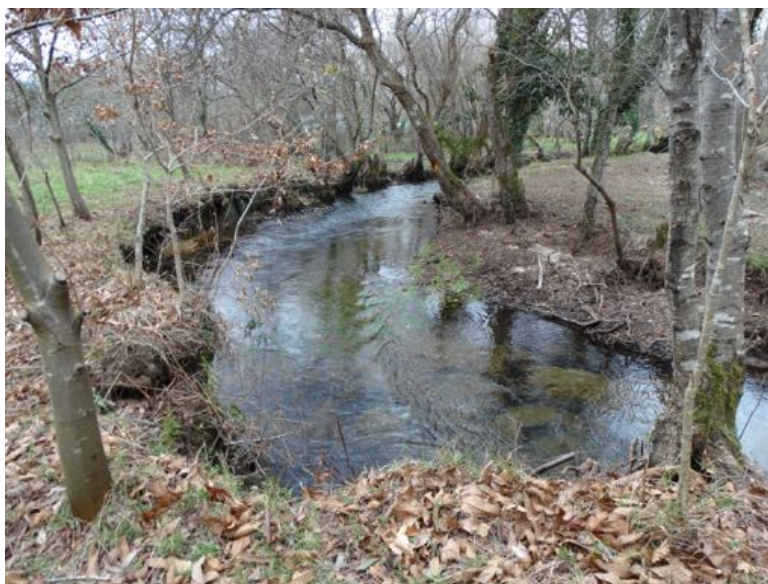
“O campamento militar da Cacharosa estivo situado a unha a a outra beira do río do Porto”

- En maio deste ano, augas abaixo da ponte Lodoso da Cacharosa (Baio), a unha e a outra beira do río do Porto, instalouse un campamento militar de Infantería e Artillería ó mando do tenente coronel Miguel Osset. A causa desta instalación militar veu motivada pola viraxe que se estaba producindo na Segunda Guerra mundial a principios deste ano, tras a derrota alemá no norte de África e en Stalingrado. Stalin esixira ós seus aliados a apertura dunha nova fronte na Europa occidental, para o que era imprescindible un desembarque das tropas aliadas concentradas en Gran Bretaña nalgún punto da costa atlántica do continente europeo. Franco debeu pensar que este desembarque ben podería ser en Galicia, e a nosa Costa da Morte era unha zona ben propicia. Do campamento de Baio saían todos os días destacamentos de soldados para vixiar a costa, do cabo de Santo Adrián (Malpica) a Traba e Camariñas.