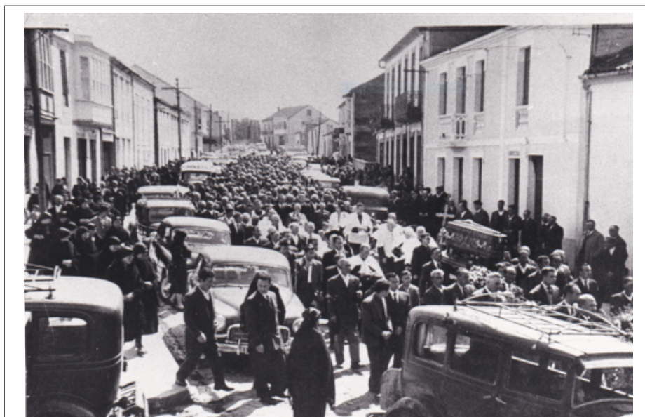
Multitudinario enterro do médico Braulio Astray Vidal

1961-1968 Recupera a alcaldía Maximino Montero Barreiro (4 a etapa no cargo). Ignoramos o motivo polo cal o fillo a ocupara durante eses dous anos.