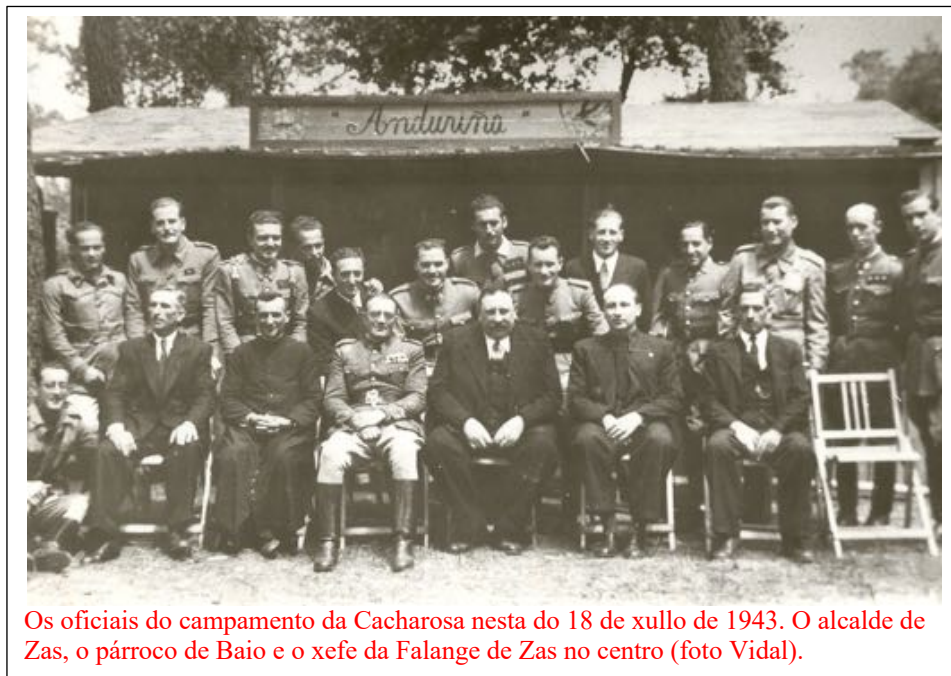
Os oficiais do campamento da Cacharosa nesta do 18 de xullo de 1943. O alcalde de Zas, o párroco de Baio e o xefe da Falange de Zas no centro.