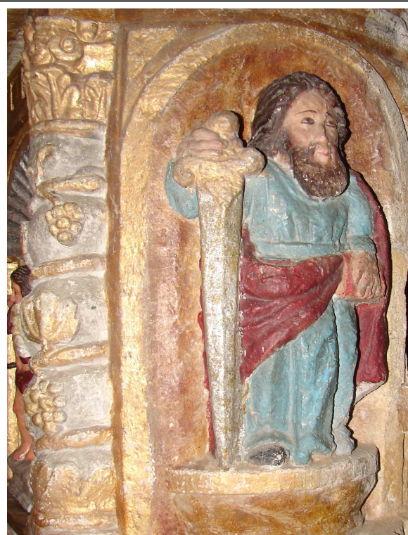
Relievo de san Paulo, do lateral sur do sagrario