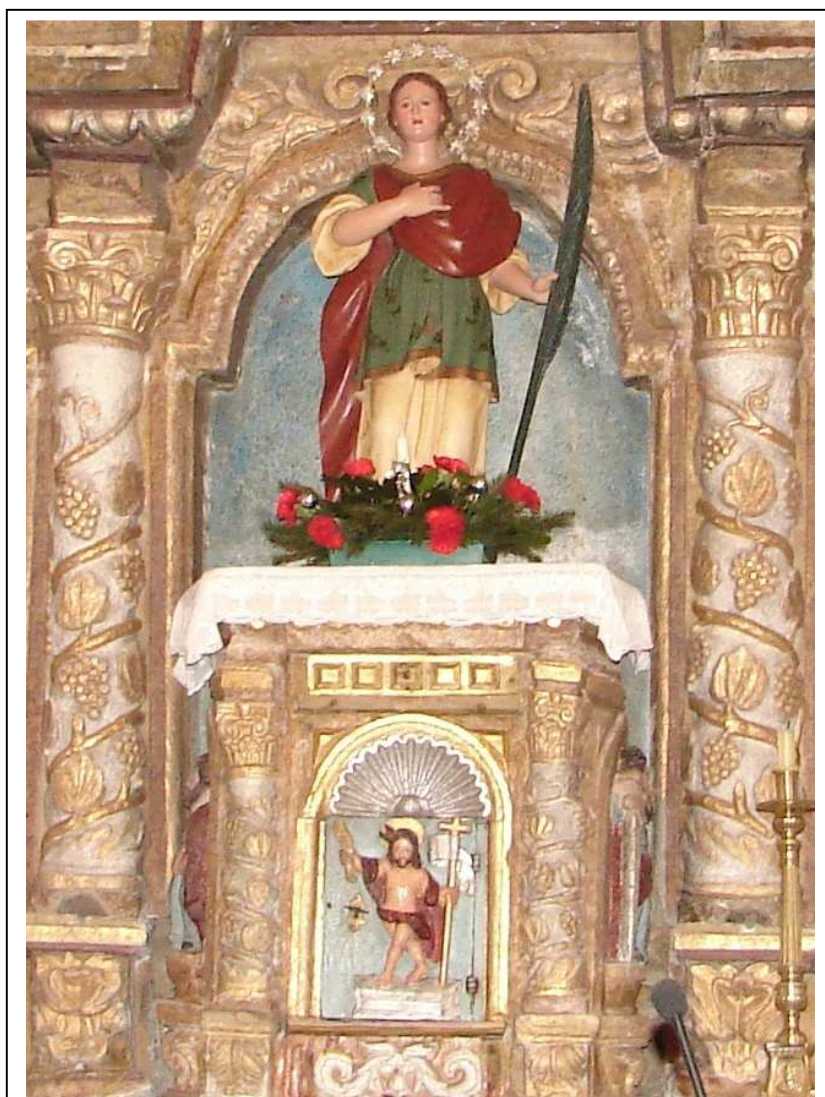
Detalle do panel central do retablo maior, coa imaxe en madeira de santa Sía sobre o sagrario

Na parte inferior do intercolumnio central colocouse un sagrario , tamén de pedra e de forma prismática, que leva nos esquinais frontais columnas salomónicas a escala. Sobre el vai a imaxe de madeira da patroa, santa Sía, que non corresponde á época nin á obra do retablo; represéntase como unha mociña vestida á moda dos patricios romanos, con túnica e manto, coa palma do martirio na man esquerda..