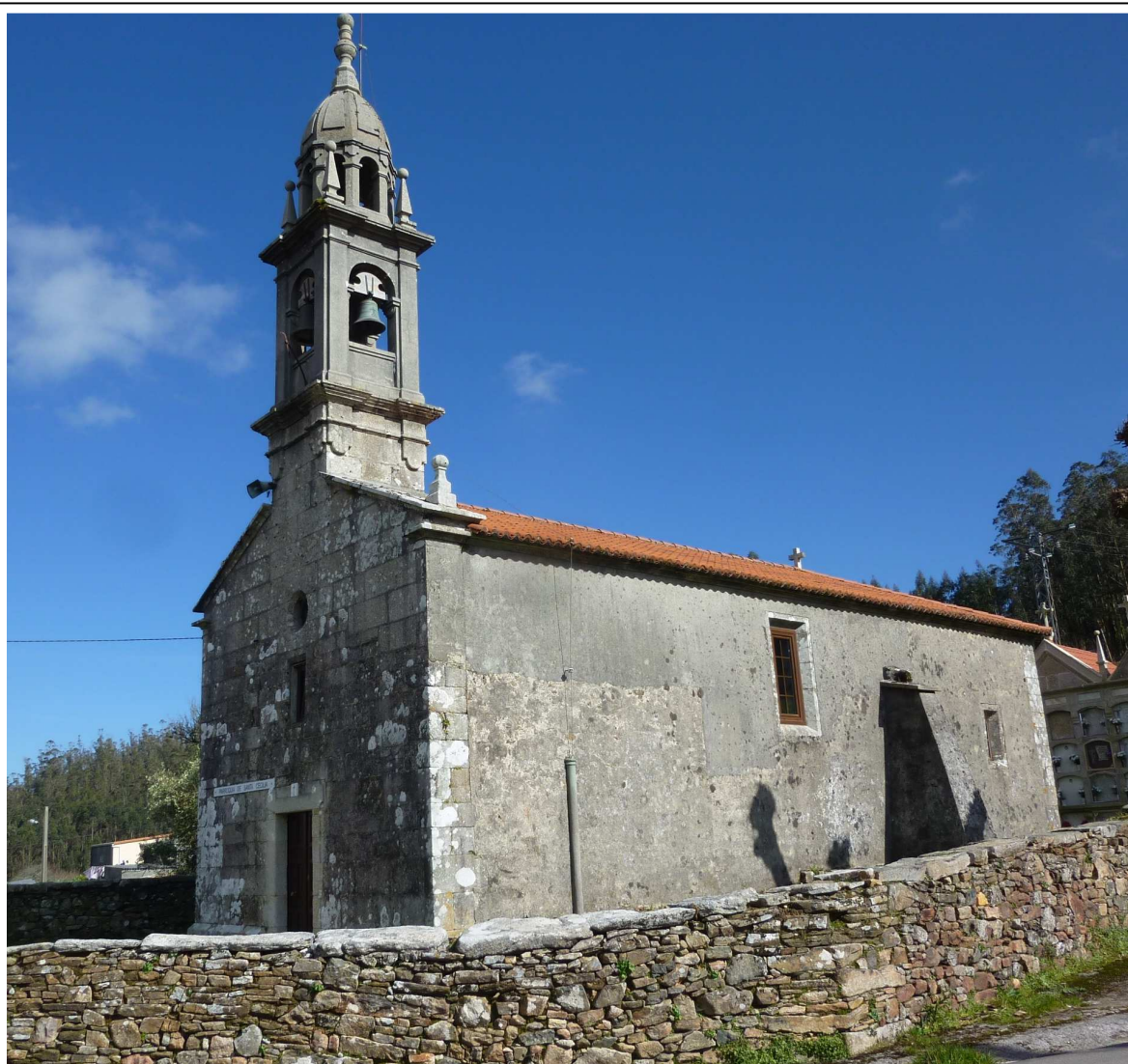
Vista xeral da igrexa parroquial de Santa Sía de Roma [foto EDR, 2017]

A fachada, lisa, remata nunha alta torre-campanario de cemento dun único corpo culminada por unha cúpula. Aínda que segue o modelo dos campanarios barrocos composteláns do séc. XVIII (segundo o modelo do arquitecto Simón Rodríguez do ano 1713 da igrexa de San Fiz de Solovio), este campanario foi construído a mediados do séc. XX.