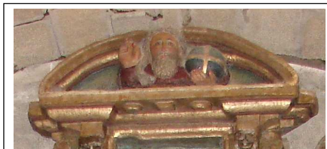
O relevo de Deus Pai coroando o retablo

Por enriba desta escena, coroando todo o conxunto, a figura dun Padre Eterno nun frontón semicircular, coa bóla do mundo nunha man e a outra en actitude de bendicir.