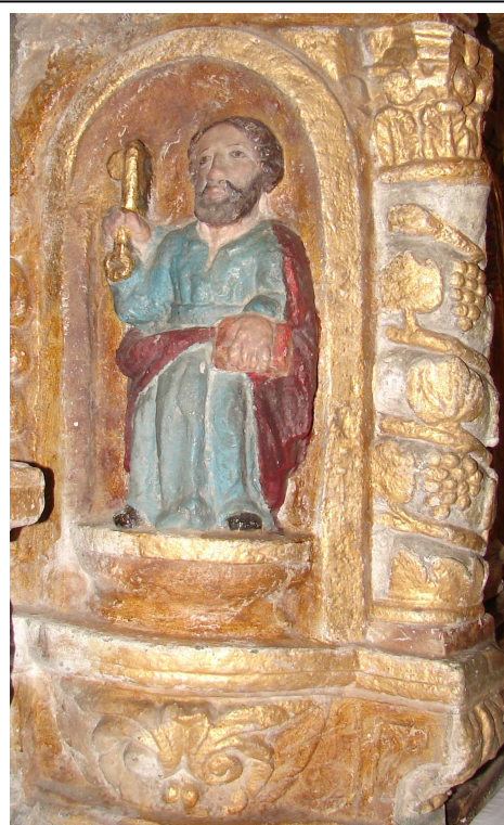
Relievo de san Pedro, no lateral norte do sagrario