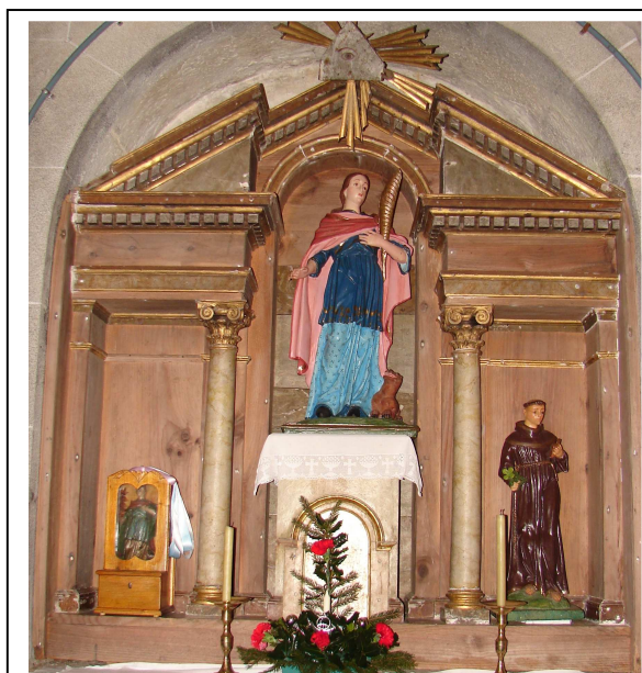
Retablo lateral norte, presidido por santa Locaia [foto XMLS]

Outras imaxes da igrexa: unha santa Sía procesional de gran tamaño; unha Virxe do Carme que semella barroca e un santo Antonio (que non leva o neno Xesús no colo, como é habitual). Estraña que non figure un san Roque, tradicional protector da peste, santo que non falta en parroquia ningunha.