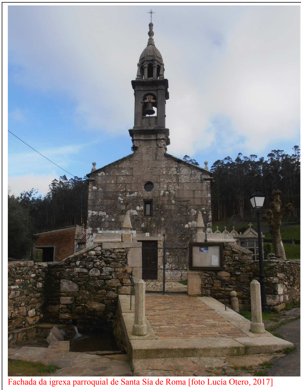
Fachada da igrexa parroquial de Santa Sía de Roma

Está situada na zona sueste do lugar de Santa Sía, perfectamente integrada entre as casas: o seu alto campanario parece presidir, dalgún xeito, o conxunto "urbano" desta bonita aldea, que melloraría moito o seu aspecto exterior se se cubrisen de tella os teitos grises de fibrocemento.