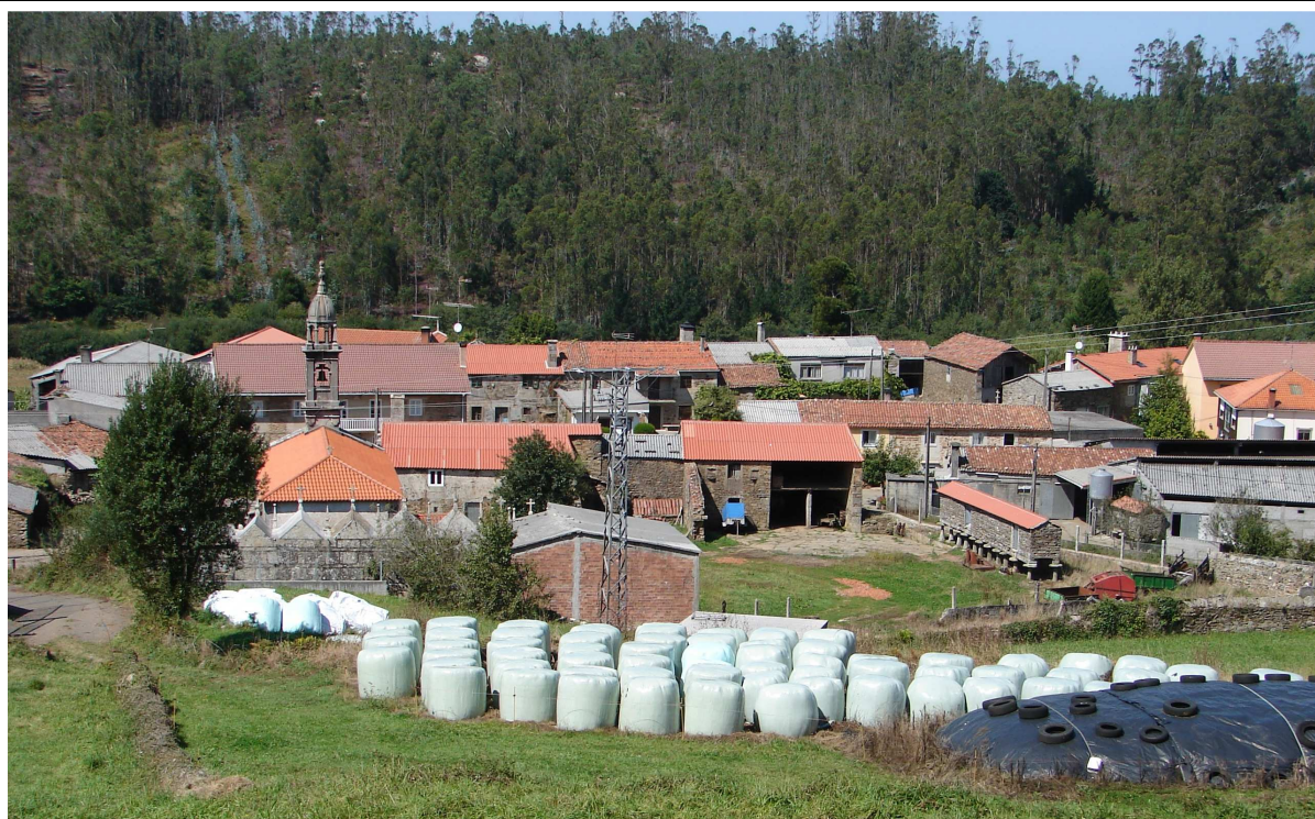
O lugar de Santa Sía, un dos poucos de hábitat concentrado do concello e da comarca