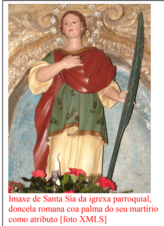
Imaxe de Santa Sía da igrexa parroquial, doncela romana coa palma do seu martirio como atributo

Cando volve de Trento, este arcebispo convoca un Concilio Provincial Compostelano, celebrado en Salamanca entre 1565 e 1569, no que se acorda aplicar decontado as normas tridentinas e, entre