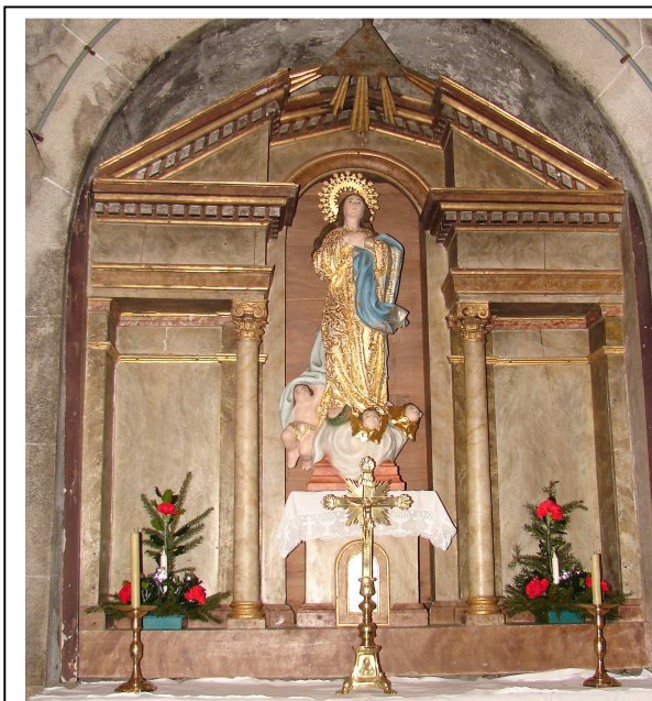
Retablo lateral sur, coa imaxe da Inmaculada