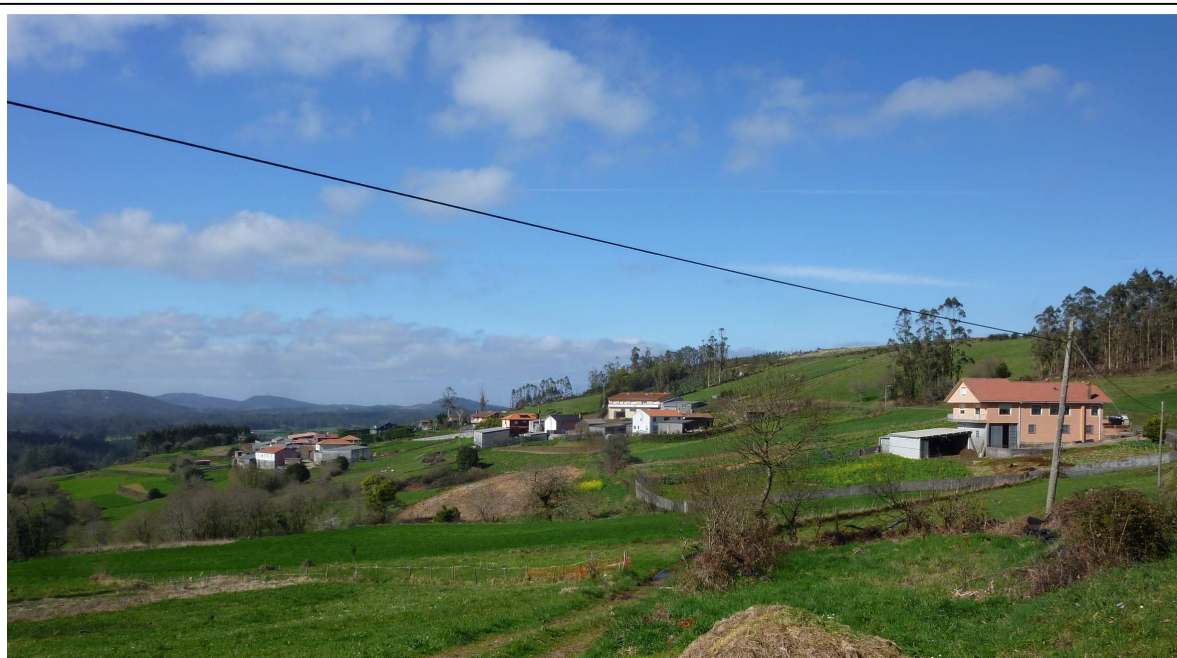
Rus, o outro lugar da parroquia de Santa Sía

Hai tamén dous cruceiros: o da igrexa, hoxe situado fóra do adro, pola súa parte sur (de 1930, segundo a inscrición do seu pedestal), e o que se atopa nunha especie de praciña do medio do lugar. Outro elemento que chama a atención aquí é o aproveitamento da auga, pois do monte baixa un bulideiro regueiro que, bordeando o adro parroquial pola parte sur e oeste, atravesa o lugar na dirección sur-norte para perderse nos herbais. Os veciños encanaron ben esta auga cantareira pola beiravía do camiño -hoxe pista asfaltada-, sen deixaren de aproveitala no posible, pois construíron lavadoiros de pedra no leito destes regos, ofrecendo hoxe un inusitado panorama etnográfico. A auga é un elemento vivo neste lugar, afeito a escoitar durante todo o ano o bulir relaxante do seu paso apurado. Os amantes do turismo rural quizais teñan aquí un sitio ideal para pasar visitar.