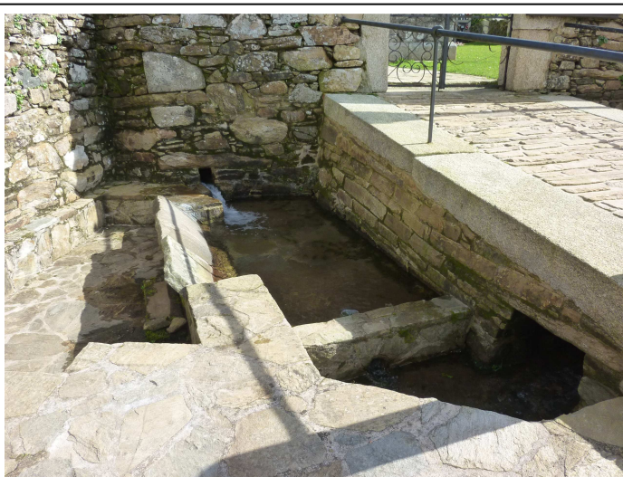
Lavadoiro fronte á fachada da igrexa de santa Sía

Tamén se informa que naquela data había 23 veciños (familias) e que na freguesía non se vendía viño (é dicir, que non había ningunha taberna). Se lle calculamos un máximo de catro persoas por casa unha familia, é posible que houbera preto de 96 habitantes na parroquia.