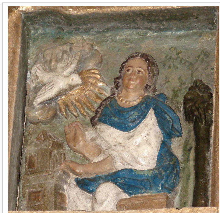
Relevo do ático, que representa a santa Sía tocando un clavecín, como patroa da música

No ático, enmarcado por pilastras de flores e froitos –e estas por voluminosas volutas- hai outro relevo de non doada identificación, pois hai elementos que non se distinguen ben. Así e todo non hai dúbida de que a figura representada é a da patroa do templo, Santa Sía , unha moza vestida cunha túnica branca e un manto azul, sentada diante dun instrumento musical, un clavecín ou clavincéfalo (está coas mans sobre as teclas en disposición de tocar); pola parte superior esquerda baixa cara a ela a branca pomba do Espírito Santo.