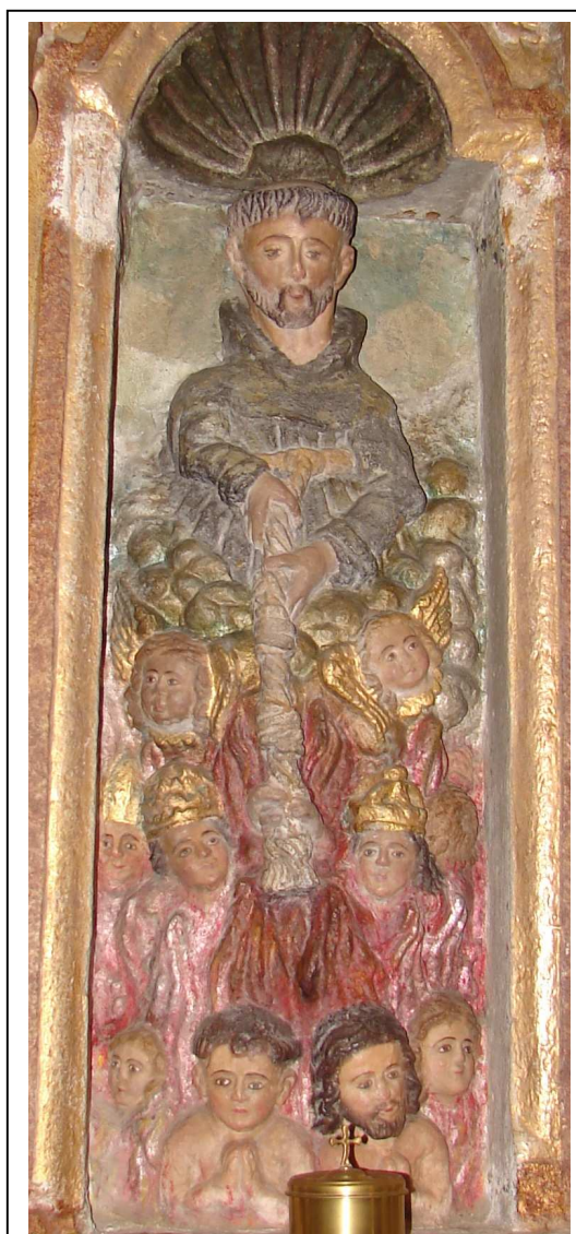
San Francisco salvando ánimas do purgatorio (relevo da parte norte do retablo maior)

O corpo divídese horizontalmente en tres paneis separados por columnas salomónicas (helicoidais) cos seus fustes percorridos de vides e pámpanos envolventes e capiteis de orde composta. En todos os paneis ou intercolumnios do retablo hai relevos pétreos de bastante vulto.