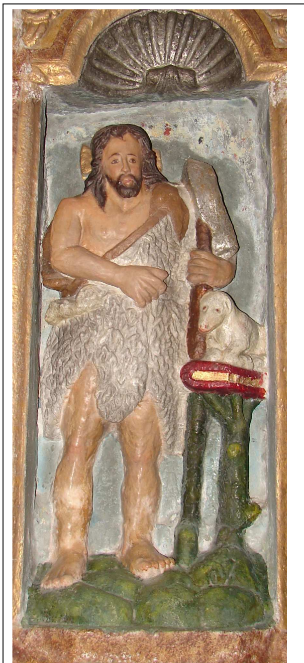
Relevo de san Xoán Bautista, da parte sur do retablo maior

O relevo da dereita do espectador representa a san Xoán Bautista, santo que recibe culto na parroquia. Viste a típica pelica de ovella (vestidura propia dos ascetas do deserto), leva un rústico caxato na man esquerda e, sobre o tronco dunha árbore descarnada, un libro sagrado, e enriba deste o año pascual, que representa a Cristo, pois fora o santo quen o anunciara.