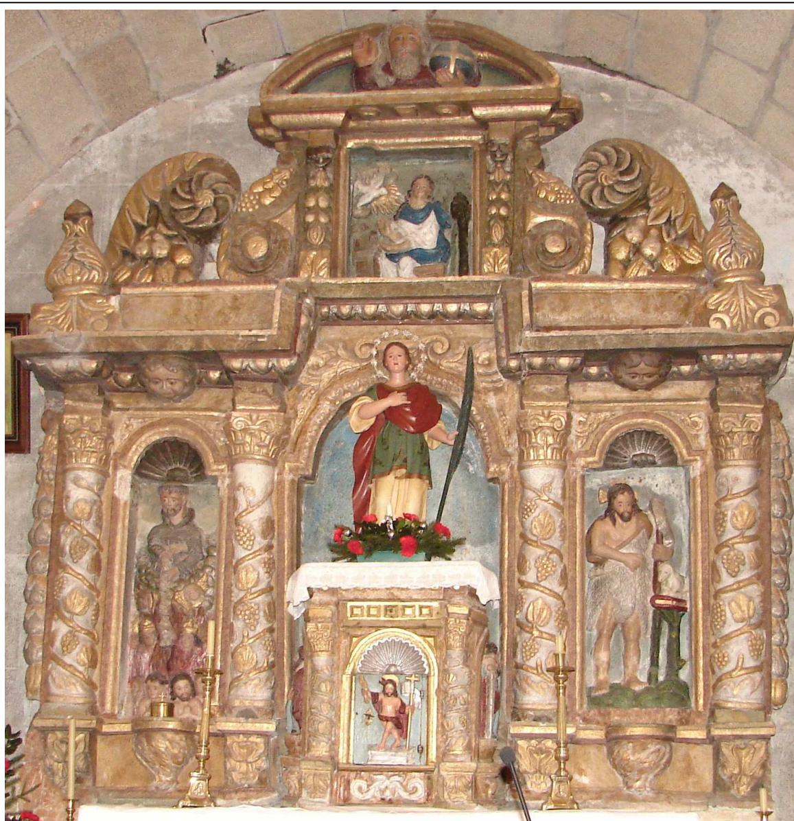
Retablo maior de Santa Sía de Roma, de pedra e de estilo barroco (primeiro terzo do séc. XVIII)

No seu interior apreciamos trazos de arquitectura de finais do séc. XVIII no presbiterio, co seu arco triunfal de ingreso e a bóveda de cantería.